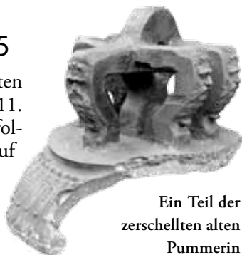
Ein Teil der zerschellten alten Pummerin

In den letzten Wochen des Zweiten Weltkrieges, in der Nacht vom 11. auf den 12. April 1945, als infolge von Funkenflug das Gerüst auf dem unausgebauten Nordturm von St. Stephan zu brennen begann, nahm die Katastrophe ihren Anfang. Der Glockenstuhl der Halbpummerin begann zu brennen und die große Glocke stürzte mit dem brennenden Gebälk in das Innere der Kirche. Gegen 11 Uhr vormittags schlugen die Flammen zwischen Hoch- und Nordturm aus der Dachhaut heraus. In der Folge stürzten Teile des riesigen Dachstuhles auf die Gewölbedecken. In den späten Vormittagsstunden des 12. April griff der Dachbrand auf das Glockenhaus der Pummerin im Hohen Turm über. Um ca. 14.30 Uhr zerschellte die größte Glocke Österreichs samt ihrem brennenden Glockenstuhl mit grauenhaftem Getöse am großen Gewölbering der südlichen Turmhalle. Ihre herabstürzenden Trümmer zerstörten das Türkenbefreiungsdenkmal. Die Reste der alten Pummerin wurden sorgsam gesammelt und gemeinsam mit anderen Glockenüberresten für einen späteren Neuguss aufbewahrt.