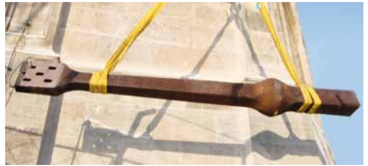
Der alte Klöppel wird abtransportiert