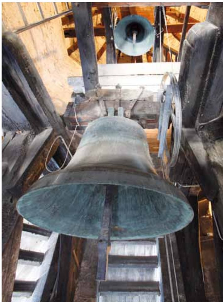
Blick in den nördlichen Heidenturm