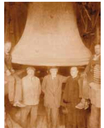
Die „Halbpummerin“ nach Fertigstellung des elektrischen Antriebs – 1925

Glocke, die ein Gewicht von über 17.000 kg hatte, wurde auf einem hölzernen Tieflader von über 200 Mitgliedern der Wiener Handwerkszünfte auf den Stephansfreithof gezogen. Nach ihrer feierlichen Weihe am 15. November 1711 wurde sie im hohen Südturm aufgezogen. In den folgenden 234 Jahren läutete sie nur zu ganz besonderen Anlässen, wie zum Beispiel der Besuch Papst Pius VI. im Jahr 1782 einer war. Zum letzten Mal erklang ihre Stimme am Ostersonntag 1938.