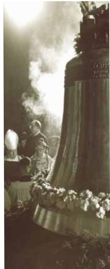
ephandom – feierliche Weihe durch

Dort blieb sie, bis in den darauffolgenden Jahren die „Welsche Haube“ des Nordturmes mit einer modernen Stahlbetonkonstruktion wieder errichtet worden war.