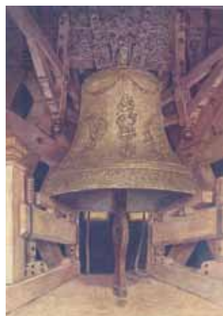
Zeichnung der alten Pummerin

Die größte, schwerste und berühmteste Glocke aber war und ist die „Pummerin“, auch „Josephinische Glocke“ genannt. Die Wiener gaben ihr alsbald wegen ihres tiefen Klanges tonmalerisch (pumpern) den Namen „Pummerin“. Sie wurde am 21. Juli 1711 von dem „kaiserlichen Stückgießer“ Johann Achamer im Auftrag Kaiser Joseph II. zum Dank für die Befreiung Wiens von der Türkengefahr im Jahr 1710 aus über 200 erbeuteten türkischen Kanonen gegossen. Sie war geschmückt mit einem Bild des hl. Joseph, des hl. Leopold sowie der Immaculata, welche von den habsburgischen Herrschern zur „Generalissima“ der kaiserlichen Heere im Kampf gegen den Erbfeind, die Türken, auserkoren war. Die