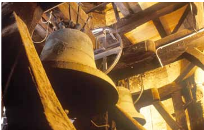
„Kantnerin“ und „Bieringerin“

Das alles bedenkend versteht man auch, dass den Glocken von St. Stephan, als Hauptkirche Wiens und Österreichs, schon seit urdenklichen Zeiten eine besondere Bedeutung zukam. Die ältesten Nachrichten über sie gehen weit zurück. So berichten uns die Annalen von Heiligenkreuz, dass am 7. August 1258 im Zuge eines großen Stadtbrandes nicht nur ein großer Teil der Stadt zerstört wurde, sondern auch „die Pfarrkirche (St. Stephan) mit ihren Glocken (cum campanis) vom Feuer verzehrt“ wurde.