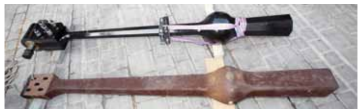
Der neue (oben) und der alte (unten) Klöppel

59 Jahre lang hatte die neue Pummerin ihren Dienst gewissenhaft versehen und die wichtigen Ereignisse sowie freudige und traurige Anlässe mit ihrem Geläute begleitet. Eine Analyse des Glockenkörpers im Jahr 2008 ergab allerdings eine zunehmende Gefährdung der großen Glocke durch den 886 kg schweren Klöppel. Aus diesem Grund wurde am Aschermittwoch, dem 9. März 2011, der alte durch einen neuen – aus steirischem Spezialstahl geschmiedeten – Klöppel ausgetauscht. Der neue Klöppel wiegt nur 613 kg und ist somit um 273 kg leichter als der alte. Durch die veränderte Proportion wird eine Verringerung der hohen Belastungswerte bewirkt und die Lebensdauer der Glocke von ca. 200 Jahren auf etwa das Zehnfache verlängert.