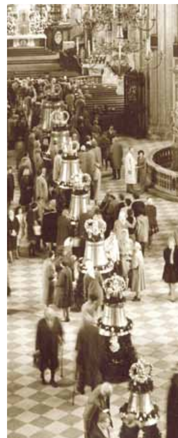
Das neue Geläute aufgestellt im St. Stephan – Kardinal Franz König 1960