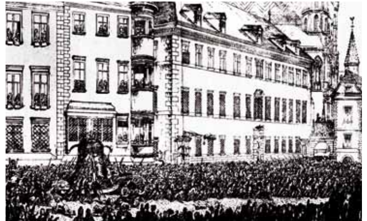
Zug der Pummerin durch die Rotenturmstraße nach St. Stephan – 1711