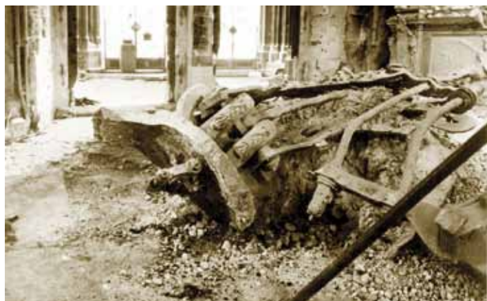
Die Trümmer der alten Pummerin in der Südturmhalle – 1945