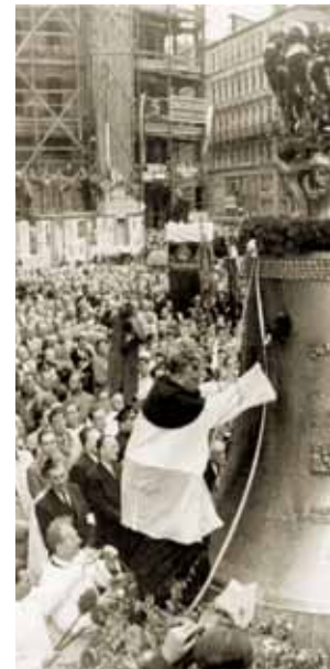
Ankunft der Pummerin vor dem Stephansdom – Weihe durch Kardinal Innitzer