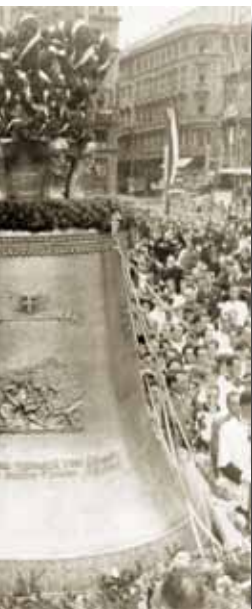
Theodor Innitzer 1952 – Aufziehen der Pummerin in den Nordturm 1957