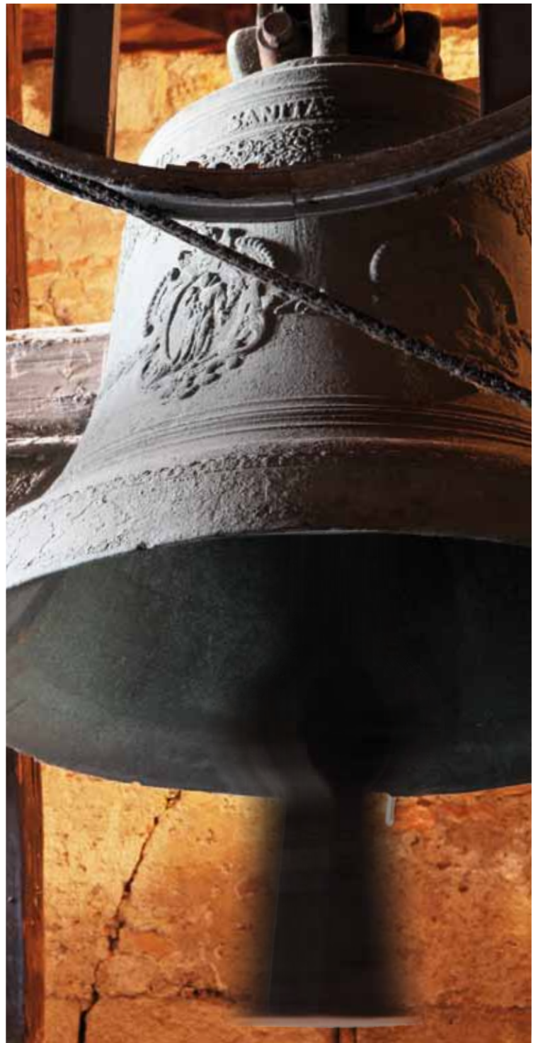
Die älteste Glocke von St. Stephan und Wien – die „Kleine Glocke“ im nördlichen Heidenturm

Der feierliche Ritus der Glockenweihe – Waschung mit Weihwasser, Salbung in Kreuzesform und schließlich Beräucherung mit Weihrauch – vertieft und erklärt zugleich ihre bedeutungsvolle Symbolik. Sie sind die Stimme Gottes und rufen zum Gottesdienst. Sie bringen auch heute noch Kunde von frohen und traurigen Anlässen. Sie geben nach wie vor den Tagen ihre Struktur und fordern zu einem Augenblick des Innehaltens und der Besinnung auf.