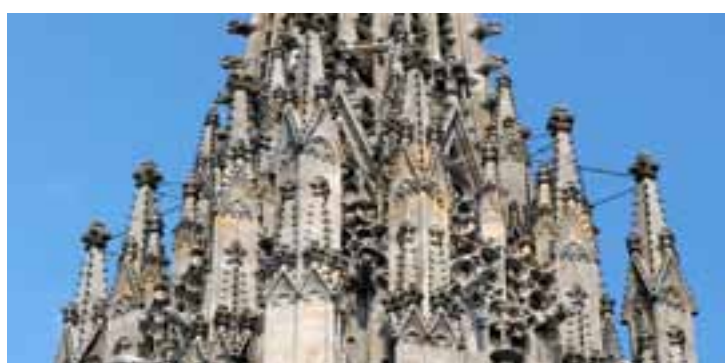
Einige der zwölf Fialtürmchen auf dem Südturm.