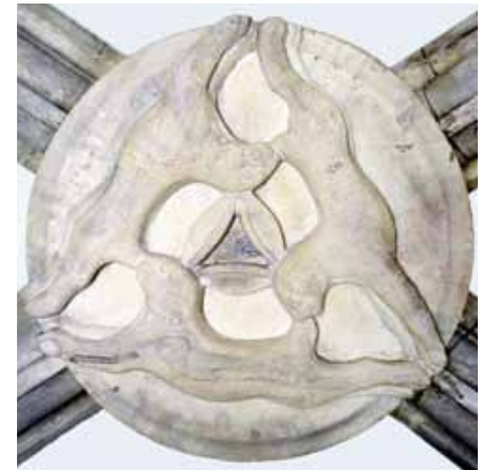
Ein Schlussstein im Mittelchor mit einem Dreihasenbild – einer markanten Allegorie der Heiligen Dreifaltigkeit: drei Hasen „vereint“ zu einer dreieckigen Komposition im Kreis.

Die Sieben , die heilige Zahl, zusammengesetzt aus drei plus vier, vereint Gott und die Welt und versinnbildlicht Vollkommenheit – die sieben Vaterunserbiten, Gaben des Heiligen Geistes, Sakramente, aber auch die sieben Todsünden.