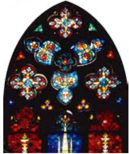
Detail eines dreigeteilten Glasfensters.