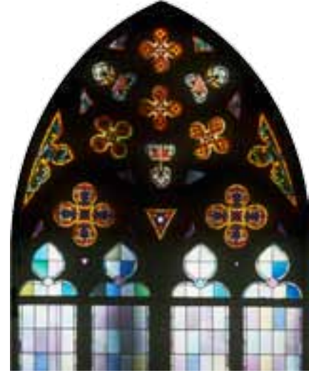
Detail eines viergeteilten Glasfensters.

Schon die vier Seiten des Kirchengebäudes hatten eine jeweils eigene Bedeutung: An der Westseite, der Seite der Dunkelheit, des Todes, des Gerichts, beginnt der „Jüngste Tag“ der Ewigkeit. Die unbesonnte Nordseite war dem Alten, die besonnte Südseite dem Neuen Testament gewidmet. Die Ostseite öffnet sich direkt ins Paradies.