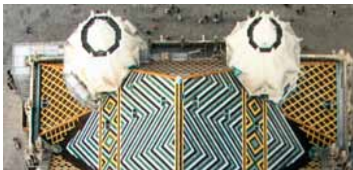
Die achteckigen Bekrönungen der Heidentürme.

Die wichtigsten Zahlen für den Kirchenraum sind aber in jedem Fall die Drei und die Vier: die Drei als Zahl der Vollkommenheit und die Vier als Zahl des irdischen Universums. Darum ist auch die Grundzahl für die Konstruktion des Domes die Zahl 37, eine Primzahl, die viele Geheimnisse in sich vereint, zusammengesetzt aus der Drei und der Vier: Der Dom ist vor allem Begegnungsort von Himmel und Erde, von Gott und Mensch.